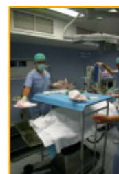
CRSO du Val d'Ouest

Le Réseau coordonne actuellement le CRSO Régional du Vinatier et le CRSO du Val d'Ouest.